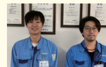
生産管理グループ

部品の管理や生産の計画をしています。みんなが協力して、計画どおり作業がスムーズに進んだとき、とてもやりがいを感じます。