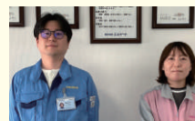
品質管理グループ

部品の管理や生産の計画をしています。みんなが協力して、計画どおり作業がスムーズに進んだとき、とてもやりがいを感じます。