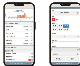
トップメニュー画面 エアコンコントロール画面