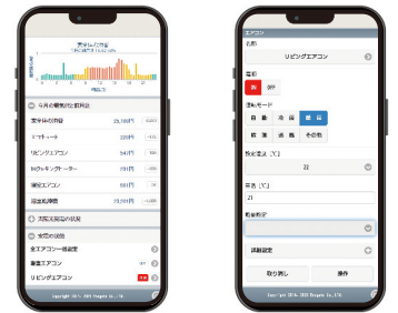
トップメニュー画面 エアコンコントロール画面